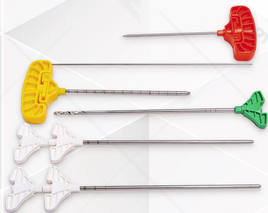
Kyphoplasty Set Code No. 33110