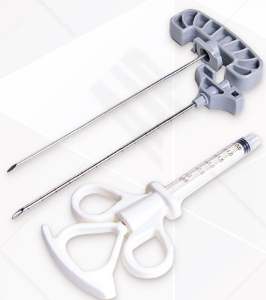
Vertebroplasty Set Code No. 33112