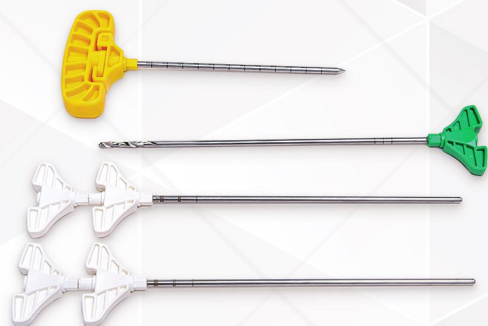
Kyphoplasty Set Code No. 33111