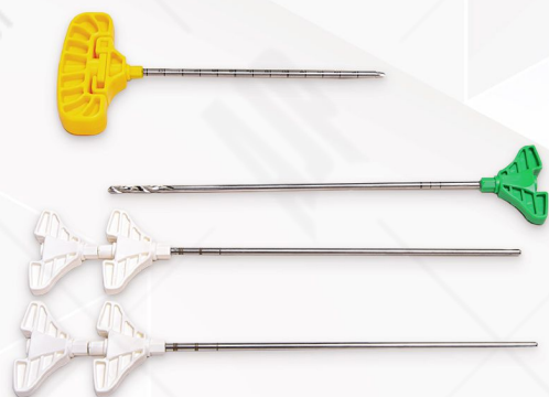
Kyphoplasty Set Code No. 33113